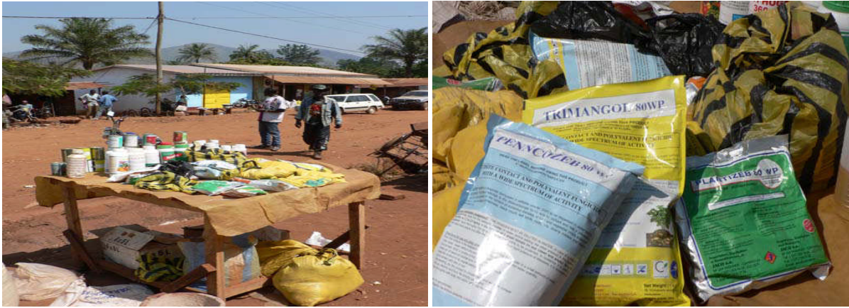
Photos 6 et 7 : Conditions de vente de produits phytosanitaires sur le marché