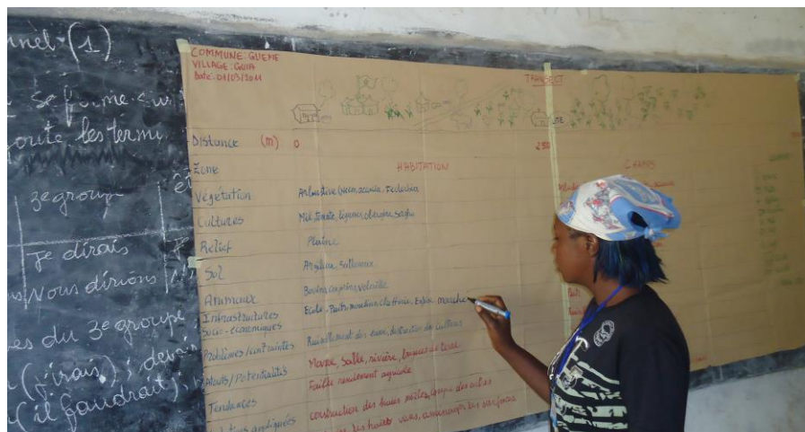
Photo3 : restitution du transect dans un village de la Commune de Guémé

Les outils ci-dessus énumérés étaient déroulés en assemblée villageoise, ou en groupe socioprofessionnel. A chaque fois pour les outils déroulés en groupe socioprofessionnel, une restitution était faite en assemblées générale.