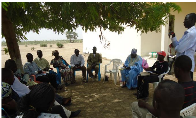
Photo1 : présentation de l'équipe d'animateurs à l'exécutif communal de Guémé

Pour la réalisation des diagnostics participatifs au niveau des villages, trois équipes de 04 personnes chacune dont un chef d'équipe et de 03 animateurs ont été mobilisées. Après les formalités d'usage et un cadrage méthodologique, les équipes se sont déportées à Guémé et ont été présentées auprès de l'exécutif communal, aux autorités administratives et de maintien de l'ordre de la ville.