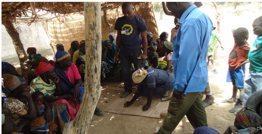
Photo 2 : élaboration de la carte de mobilité dans un village de la commune de Guémé

L'intervention de l'OAL dans chaque village commençait par une assemblée générale introductive, qui était le cadre des échanges avec les populations. C'était l'occasion de clarifier l'objet de la mission et d'arrêter le calendrier et les modalités pratiques des différentes étapes ainsi que des outils qui seront utilisés.