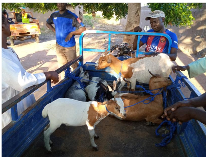
Photo 12: Saisie des chaèvres en divagation dans les espaces reboisés

En date du 09 juillet 2019 une descente sur le site de Ouro-Tchaido a été organisé avec l'appui du service d'hygiène pour arrêter les animaux en divagation sur les espaces reboisés. au cours de cette activité, 09 chèvres ont été capturer et remis au chef du village. A cette occasion le chargé du reboisement a saisi cette opportunité pour sensibiliser d'avantage des population et a relacher les animaux qui ont été immédiatement été conduit dans les enclos.