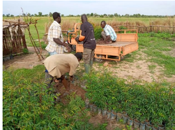
Photo 9: Manutention et transport des plants auprès des pépiniéristes privés

Au cours de cette activité, nous avons utilisé un tricycle pour le transport des plants d'une capacité de 500 plants/tour. Au terme de cette activité, les chargé de la manutention ont perçus un montant total de 570 000 F payé en deux tranches tous les samedi.